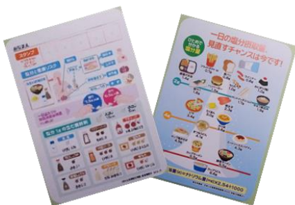
塩分資料(マグネット付) 栄養相談5回継続の方へプレゼント