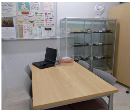
栄養相談室（感染対策をして行っております）