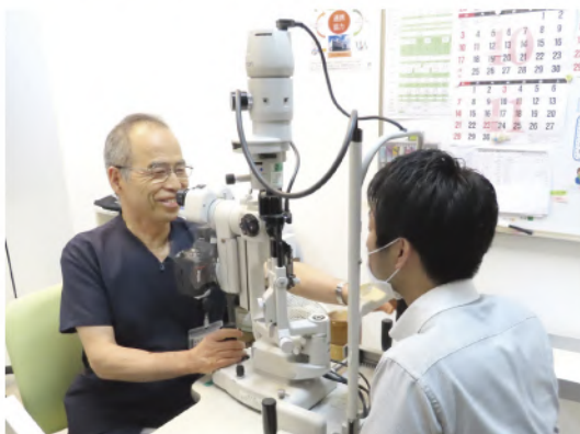
細隙灯顕微鏡にて検査の様子