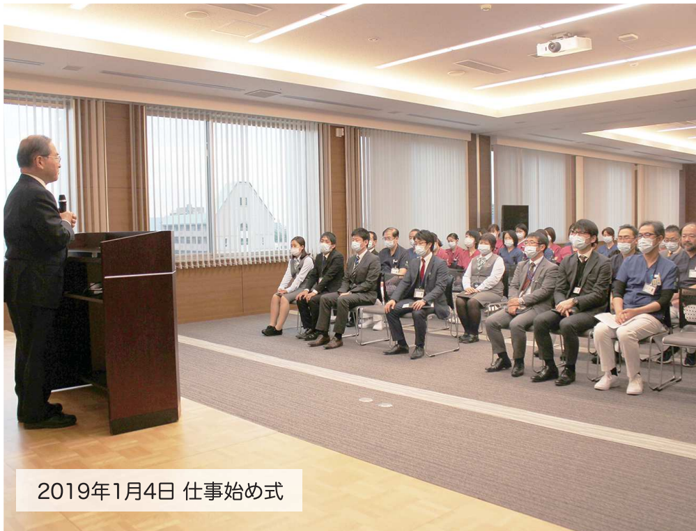
2019年1月4日 仕事始め式